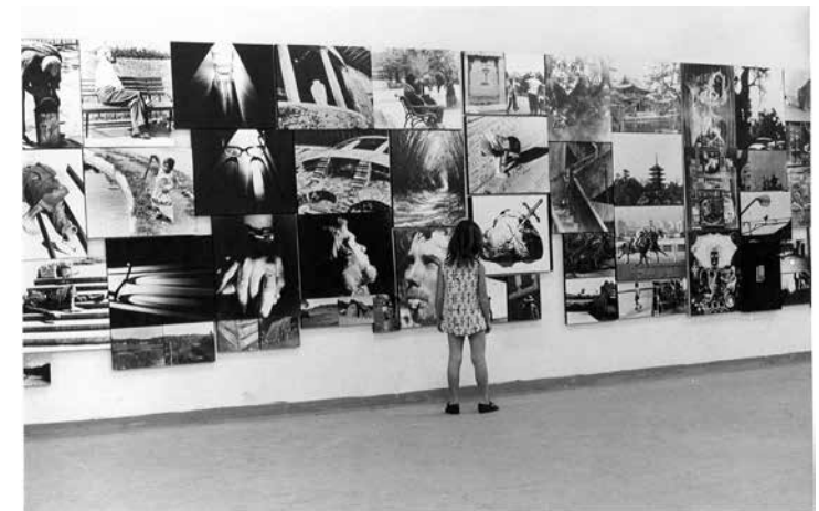
Figura 8 • Exposição O fotógrafo desconhecido , 1972. Museu de Arte Contemporânea, Universidade de São Paulo, Arquivo MAC USP.

O Museu recebeu 266 inscrições para a exposição e a comissão organizadora decidiu aceitar todos os trabalhos inscritos, separando, no entanto, as fotos que considerava como “uma autêntica linguagem