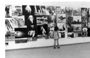
Figure 8 Exhibition O fotógrafo desconhecido , 1972.

The Museum received 266 entries for the exhibition and the organizing committee decided to accept all entries, separating, however, the photos that it considered as "an authentic photographic language", from others that would be indicative of "creative indexes in process" 276 . This resulted in a list of selected photographers, and another of participating photographers 277 . According to Walter Zanini, the exhibition would achieve two main objectives: