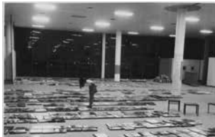
Figure 9 Exhibition catalog cover O fotógrafo desconhecido , 1972. Museu de Arte Contemporânea da Universidade de São Paulo, MAC USP Archive.

Choosing from hundreds of photos was distressing for me. In each of them, observing carefully, I discovered the universe of people: joys, sorrows, neuroses, limitations, repressions. Each discovery, being part of a rather fascinating game, let me lose some of the criteria of choice. There was only one way to make this choice: objectively, trying to situate the photo from its proposition and the photographic language used for its realization; based on the photo itself and the photography language not taken as "grammar", but as a possibility of multiple choice and creation. Djalma L. Batista 280 .