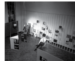
Figure 1 Exhibition of Thomas Farkas, Estudos fotográficos , 1949. Museu de Arte Moderna de São Paulo (MAM SP).

The exhibition Estudos fotográficos , a Thomaz Farkas retrospective, was the first presented in a Brazilian museum in which photography was considered as an artistic manifestation. Held in the year of foundation of the MAM SP, it brought together documentary images and formal experiments through a bold expography, by the architects Jacob Ruchti and Miguel Forte*.