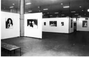
Figure 5 Exhibition Beleza de pedra , 1969. Museu de Arte Contemporânea da Universidade de São Paulo. MAC USP Archive.

The photographs, enlarged in three sizes, were mounted in the form of a poster, that is, adhesive on a rigid support 252 . This option shows that there was no concern to follow the modern museological canon, already consecrated for photographic exhibitions, with the use of passe-partout and frames. On the contrary, there was the clear purpose of transgressing it. The exhibition, also according to the testimony of Walter Zanini, was closed by the military 253 and did not result in the incorporation of works in the collection of the Museum.