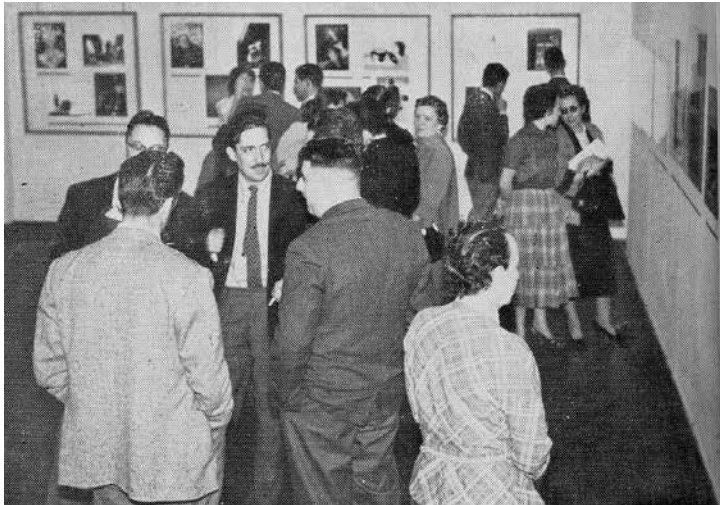
Figura 2 • Exposição Otto Steinert e seus discípulos , 1955. Museu de Arte Moderna de São Paulo. Boletim Foto Cine , São Paulo, n.v 97, ago.-out. 1955.

As exposições de fotografia realizadas no MAM SP entre os anos de 1949 e 1955 apresentam, em seu conjunto, forte coerência na legitimação artística de um certo tipo de fotografia, de herança vanguardista, que vinha sendo desenvolvida no âmbito do Foto Cine Clube Bandeirante 22 . A estreita relação do Bandeirante com o Museu de Arte Moderna nesse período evidencia-se, ainda, na realização de uma mostra de fotografia dos associados do fotoclube em uma sala especial na II Bienal de São Paulo, que, naqueles anos, ainda era um evento organizado pelo Museu de Arte Moderna 23 .