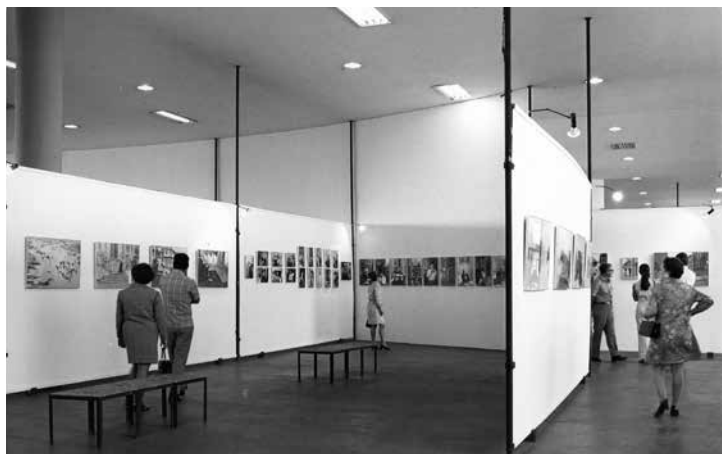
Figura 6 • Exposição Cartier-Bresson: fotografias recentes , 1970, Museu de Arte Contemporânea, Universidade de São Paulo, Arquivo MAC USP.

No meu modo de ver a fotografia nada mudou desde a sua origem, exceto nos seus aspectos técnicos os quais não são minha preocupação principal. A fotografia é uma operação instantânea que exprime o mundo em termos visuais, tanto sensoriais como intelectuais, sendo também uma procura e uma interrogação constantes. É ao mesmo tempo o reconhecimento de um fato numa fração de segundo e o arranjo rigoroso de formas percebidas visualmente, que conferem a esse fato expressão e significado.