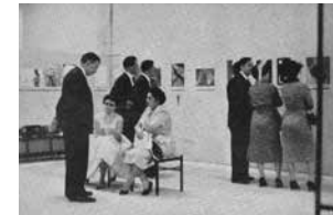
Figure 4 Special room of photography of the Foto Cine Clube Bandeirante Photo. II Bienal de São Paulo, 1953. Boletim Foto Cine , São Paulo, n.87, Feb.-Mar./1954, p. 12.

The photographs were chosen from those left by FCCB members in the Club archives given the haste with which the exhibition needed to be set up. According to Geraldo de Barros, the exposed images received praise from such illustrious visitors as Walter Gropius, Max Bill and Henri Moore 204 . Decades later, Wolfgang Pfeiffer, who was then the director of the Museu de Arte Moderna de São Paulo, still remembered the exhibition with great enthusiasm: