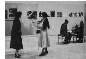
Figure 3 Special room of photography of the Foto Cine Clube Bandeirante Photo. II Bienal de São Paulo, 1953. Boletim Foto Cine , São Paulo, n.87, Feb.-Mar./1954, p. 12.