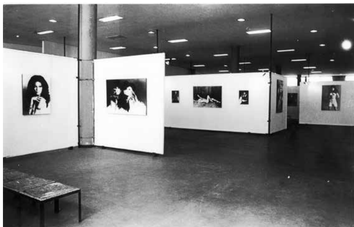
Figura 5 • Exposição Beleza de pedra , 1969. Museu de Arte Contemporânea, Universidade de São Paulo. Arquivo MAC USP.

As fotografias, ampliadas em três tamanhos, foram montadas em forma de pôster, ou seja, adesivadas sobre suporte rígido 87 . Essa opção mostra que não havia preocupação em seguir o cânone museológico moderno, já consagrado para exposições fotográficas, com a utilização de passee-partout e molduras. Ao contrário, havia o propósito claro de