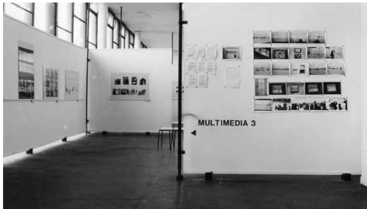
Figura 13 • Exposição Multimedia 3, 1976. Museu de Arte Contemporânea da Universidade de São Paulo