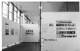
Figure 13 Exhibition Multimedia 3 , 1976.

In the present manifestation we always find the exploration of the characteristic and inherent aspect of the instantaneous procedure of recording the photograph, or there are photomontages and reworked photos used essentially for the transmission of concepts, extrapolating the exclusively aesthetic level. The photo does not lie on the plane of art for art, but falls within the scope of other multimedia, related to information and communication. The questioning, investigation, confrontations, denotations, analogies, reflections, at the level of criticism, through the photographic image, predominate in the works presented here 306 .