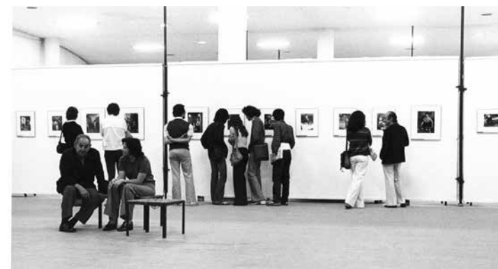
Figura 12 • Exposição 70 Fotos de Brassai, 1974, Museu de Arte Contemporânea, Universidade de São Paulo