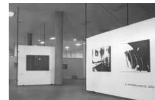
Figure 7 Exhibition 9 Fotógrafos de São Paulo , 1971. Museu de Arte Contemporânea da Universidade de São Paulo, MAC USP Archive.

who presented three photos entitled Mulher Xincrin , together with the work Inês , an object elaborated with photography, wood and acrylic that today forms part of the MAC USP collection 267* .