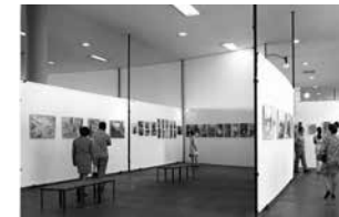
Figure 6 Cartier-Bresson: fotografias recentes , 1970. Museu de Arte Contemporânea da Universidade de São Paulo, MAC USP Archive.

In my view photography has not changed since its origin, except in its technical aspects which are not my main concern. Photography is an instant operation that expresses the world in visual, both sensory and intellectual terms, and is also a constant search and interrogation. It is at the same time the recognition of a fact in a fraction of a second and the rigorous arrangement of visually perceived forms, which give this fact expression and meaning.