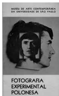
Figura 11 • Capa do catálogo da exposição Fotografia experimental polonesa, 1974 .

autores. Pelo que pudemos levantar, os participantes da mostra eram fotógrafos e/ou artistas que, em sua maioria, tiveram significativa atuação na Polônia, nas décadas de 1960 e 1970, no âmbito da arte conceitual 130 . Segundo divulgação do MAC USP, eram “os mais destacados fotógrafos de vanguarda da Polônia, participantes de grupos de Cracóvia, Torun e Lodz, quase todos nascidos nas décadas de 1920 e 1930, geralmente de larga atuação inclusive no plano internacional” 131* . As obras, em sua maioria, conferiam um caráter objetual à fotografia por meio da aderência de imagens recortadas a suportes rígidos. Há ainda sequências fotográficas e imagens que passaram por diversos tipos de intervenção. Logo após a mostra, os artistas doaram as 38 obras expostas ao acervo do MAC USP por intermédio do Consulado Geral da Polónia 132 .