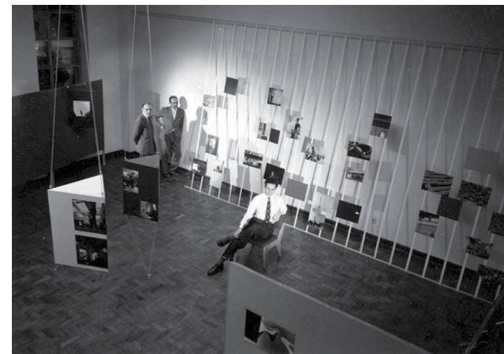
Figura 1 • Exposição de Thomas Farkaz. Estudos fotográficos , 1949. Museu de Arte Moderna de São Paulo.

Fotógrafo alemão de renome na ocasião, fundador do Grupo Fotoforma e ideólogo da chamada Fotografia Subjetiva, Otto Steinert tinha grande penetração no circuito fotoclubista internacional. Ele enviou um portfólio de cerca de cinquenta imagens, de sua autoria e de diversos de seus alunos, para o Foto Cine Clube Bandeirante que foi responsável pela realização da exposição do MAM SP 21* .