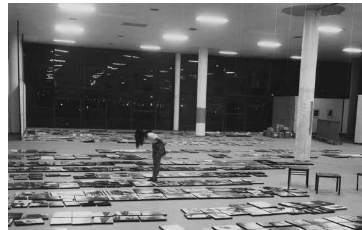
Figura 9 • Capa do catálogo da exposição O fotógrafo desconhecido, 1972.

A divergência de pontos de vista entre os textos publicados no catálogo e a documentação do Arquivo do MAC USP indicam que não houve consenso entre os membros da comissão organizadora a respeito da inclusão de todas as fotos na exposição, apesar de esta opção ter prevalecido 116 . Em correspondência não datada, enviada a Walter Zanini, Maureen Bisilliat faz menção a uma reação intempestiva de sua parte durante o processo de avaliação das fotos, pela qual se desculpa. No entanto, aproveita a ocasião para formalizar sua indignação com a solução adotada, que ela afirma ser: “um tanto depreciativa e niveladora [sic], que para um público pouco familiarizado com a linguagem plástica em geral e fotográfica em especial, seria, involuntariamente, desorientador – um tipo de ‘fotocineclubebandeirante’ de solarizações” 117 .