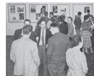
Figure 2 Exhibition Otto Steinert e seus discípulos , 1955. Museu de Arte Moderna de São Paulo (MAM SP). Boletim Foto Cine , São Paulo, n.v97, Aug.-Oct. 1955.

Renowned German photographer at the time, founder of the Fotoforma Group and ideologist of so-called Subjective Photography, Otto Steinert had great penetration in the international photoclub circuit. He sent a portfolio of around fifty images of his own and several of his students to the Foto Cine Clube Bandeirante, which was responsible for the MAM SP exhibition 186 .*