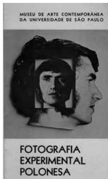
Figure 11 Exhibition catalog cover Fotografia experimental polonesa , 1974. Museu de arte contemporânea do Universidade de São Paulo, MAC USP Archive

In April 1974, MAC USP would receive a new exhibition sent by the Museum of Modern Art of New York: 70 Photos by Brassai. The exhibition, curated by John Szarkowski, presented photographs from the MoMA collection alongside photos from Brassai's private collection. In the text of the catalog, Szarkowski defends the specificity of the photography: