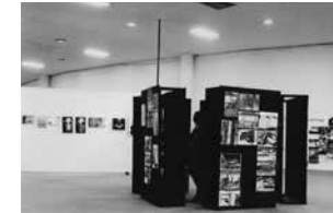
Figure 10 Exhibition O fotógrafo desconhecido , 1972. Museu de Arte Contemporânea da Universidade de São Paulo, MAC USP Archive.

Also in relation to this exhibition, we must try to understand the cultural context in which the proposal to present photographs by unknown people in an art museum arises. In the 1960s and 1970s, this idea was championed by John Szarkowski, then curator of the MoMA Photography Department. This type of production, termed as vernacular, encompassed amateur photography and commercial photography. More precisely, it could be said that it encompassed every photograph produced without artistic ends, by those who did not possess art knowledge or any other kind of specialized iconographic reference, whether they were simply unknown or actually anonymous. The importance and originality of vernacular photography would still lie, according to Szarkowski, in its ability to highlight the inherent characteristics of the medium, hence the importance of exhibiting it in art museums 284 .