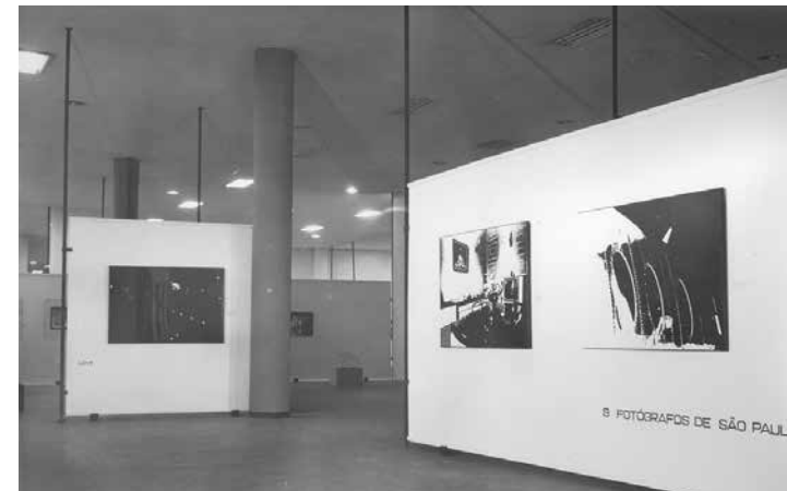
Figura 7 • Exposição 9 fotógrafos de São Paulo, 1971. Museu de Arte Contemporânea, Universidade de São Paulo, Arquivo MAC USP.

Cristiano Mascaro, por sua vez, apresentou vinte fotografias produzidas durante viagem que realizou a Bolívia, a serviço da revista Veja , onde registrou flagrantes da comoção popular durante o enterro do presidente René Barrientos, em 1969 103 . As imagens, de pequeno formato, montadas em forma de pôster, ressaltam a expressão de dor dos personagens em trajes de luto. Já Boris Kossoy apresentou dez imagens de seu ensaio Viagem pelo fantástico , publicado em livro naquele mesmo ano 104* .