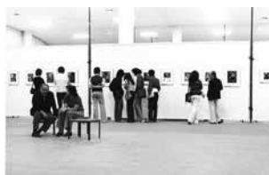
Figure 12 Exhibition 70 fotos de Brassai, 1974, Museu de Arte Contemporânea da Universidade de São Paulo, MAC USP Archive.

His technique responds perfectly to his vision. His photos, at first glance primitive, demonstrate precision and accuracy to those unfamiliar with them. The forms, spaces and textures of their themes are expressed with totality and plastic unity. Brassai's photographs are not "experimental". They are free of gratuitous refinements and infatuation with photography as technique. They do not bring to mind the act of photographing; it is as if the subject reproduces himself in some way that is also inherent to him. This profound authority and dignity are the measure of Brassai's genius 298 .