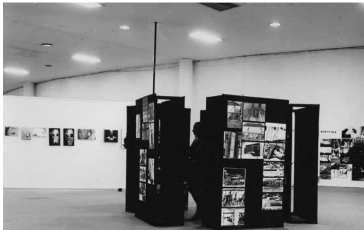
Figura 10 • Exposição O fotógrafo desconhecido , 1972, Museu de Arte Contemporânea, Universidade de São Paulo, Arquivo MAC USP.

As obras reproduzidas, no catálogo O fotógrafo desconhecido , atestam que não foram enviadas apenas fotos diretas, mas também objetos que incluíam fotografias. A exposição contou com uma montagem arrojada, não uniforme, que contemplou imagens em forma de pôster, distribuídas lado a lado, sem espaçamento; fotos, com ou sem passé-partout , fixadas diretamente na parede, de modo informal; e obras em suportes especiais. O MAC USP iria adquirir, pouco tempo depois, para o seu acervo, obras de sete dos participantes dessa exposição 118 . A aquisição de parte das obras selecionadas já havia sido anunciada, como prêmio, no regulamento da exposição.