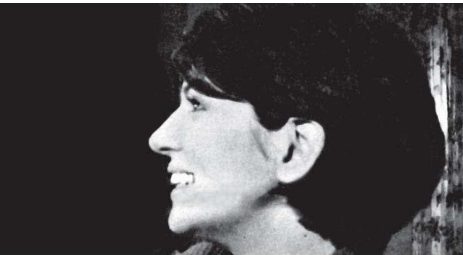
Em Beto Rockfeller e em O Rei do Gado, com Raul Cortez e Glória Pires