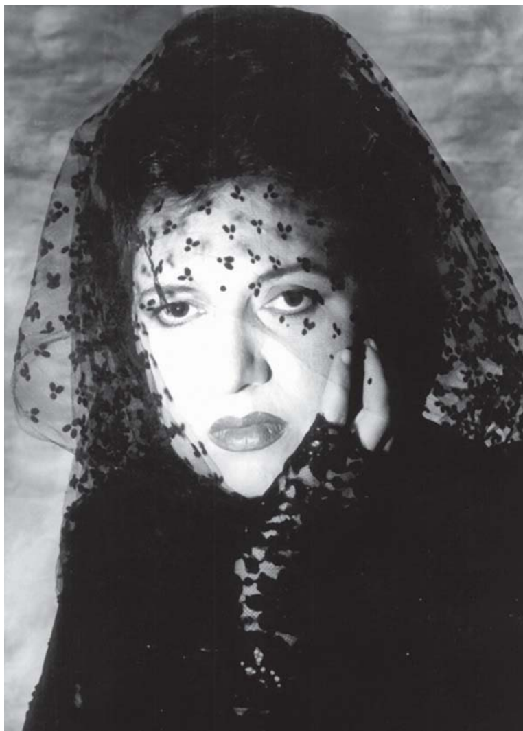
Madame Blavatsky