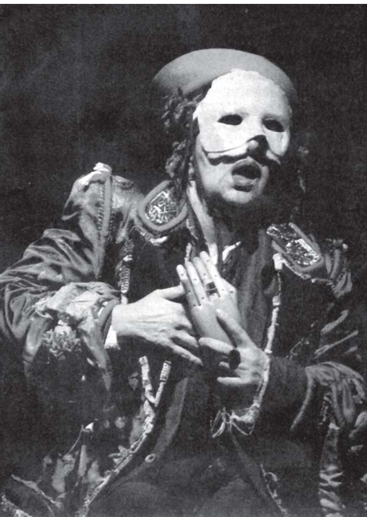
Cena final de Fausto Zero