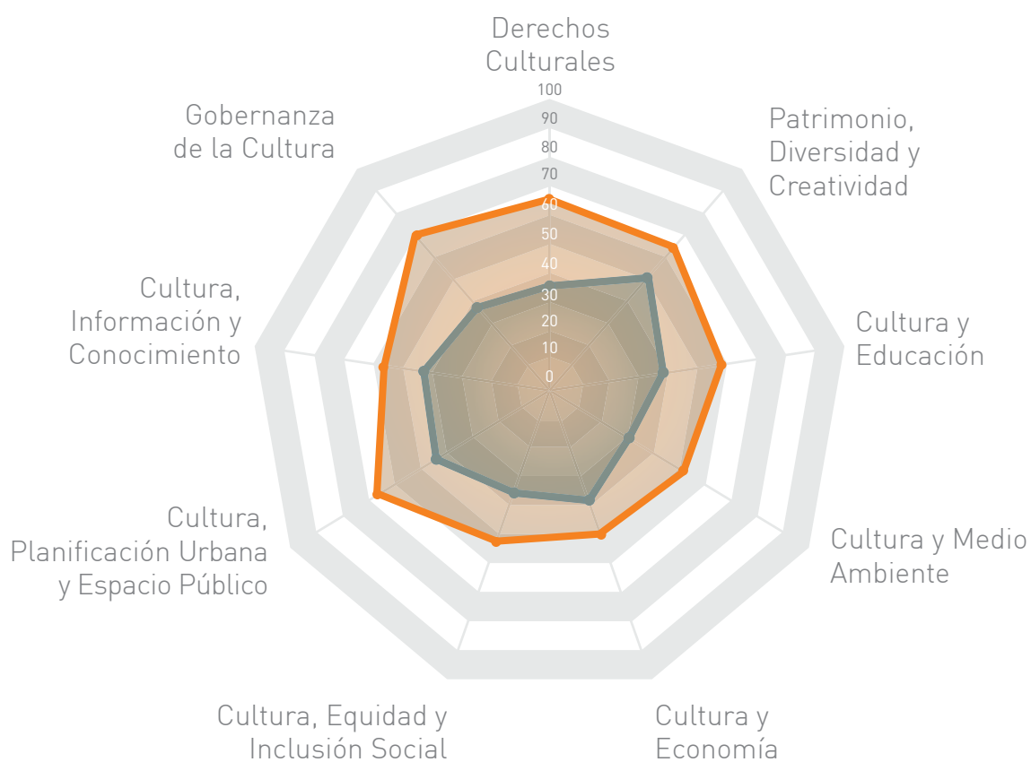
Figura 1: Autoevaluación de Gran Dandenong y datos del Panel Global 2015