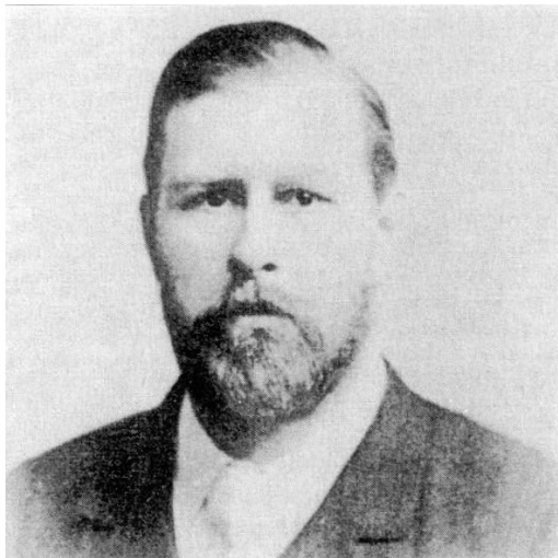
Retrato de Bram Stoker.

do governador geral em Dublin, vários romances, uma recolha de contos infantis, Under the Sunset (1882), mas a escrita era para ele um passatempo a que apenas podia entregar-se durante os seus raros momentos de lazer.