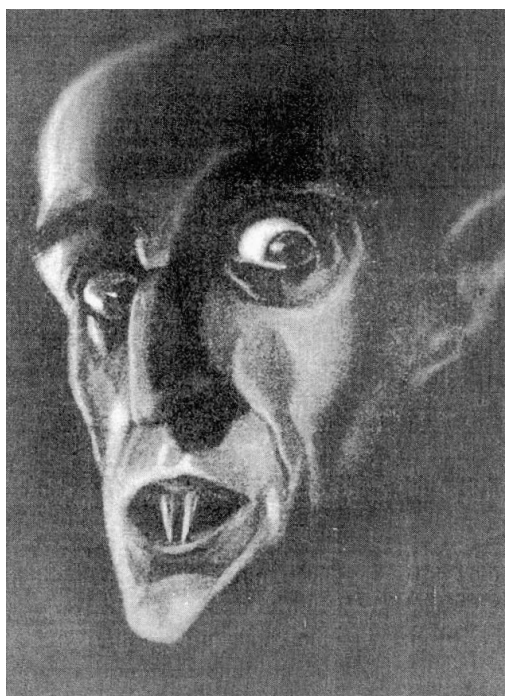
Modelo da personagem do conde Orlok, para o ator Max Schreck, em Nosferatu, o Vampiro .

Bela Lugosi teve o mérito de dar à personagem imaginada por Stoker um rosto seguramente muito diferente daquele que é descrito no romance. Enquanto este último nos apresenta o vampiro como um homem muito idoso com cabelos desgrenhados e um grande bigode, Lugosi surgia como um homem na casa dos quarenta, de rosto seráfico e cabelos negros cuidadosamente empastados, de acordo com a moda da época. Com o seu traje de noite, laço ao pescoço e, principalmente, a grande capa negra, que Raymond Huntley ostentara em cena antes dele e cujas abas agitava como se fossem duas enormes asas de morcego, Lugosi impôs um estilo que se prolon-