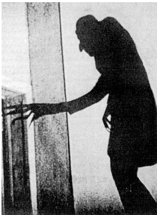
Drácula, aliás Nosferatu, visto pelo expressionismo alemão.

o planeta. A personagem imaginada por Stoker inspirou dezenas de filmes, de desenhos animados, de romances, de novelas e de bandas desenhadas, e supera em notoriedade os heróis mais conhecidos da literatura popular contemporânea. No entanto, contrariamente aos heróis sem medo e sem mácula que são Tarzan, Zorro e Super-Homem ou, num registo diferente, Sherlock Holmes, Hercule Poirot e o comissário Maigret, Drácula nada tem a priori que possa atrair a nossa simpatia. É um monstro que só pode suscitar medo e horror, um ser híbrido e nefasto, um morto-vivo que pertence ao mundo do pesadelo e das trevas. Apesar disso, ao cabo de um século, não deixou de fascinar o público; cada geração vê-o com um olhar diferente e, ao longo dos anos, elaborou-se em torno desta personagem paradoxal aquilo que pode muito bem ser designado por mito dos tempos modernos. Tema de superstições de um passado há muito encerrado, Drácula integrou-se no mundo contemporâneo. Um século após a sua aparição em literatura, é mais que nunca atual, mesmo quando se está no direito de considerar que o romance que lhe deu luz envelheceu consideravelmente; mas é das obras que jamais morrem, pois deixaram na consciência coletiva uma marca indelével.