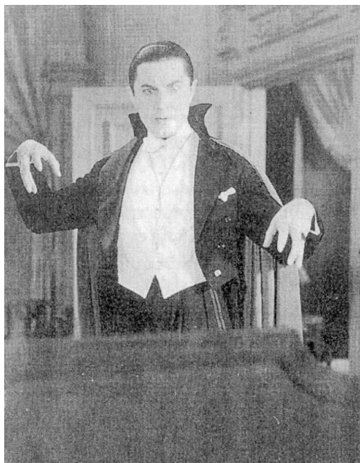
Bela Lugosi faz entrar a personagem de Drácula na lenda ( Drácula , Tod Browning, 1931).