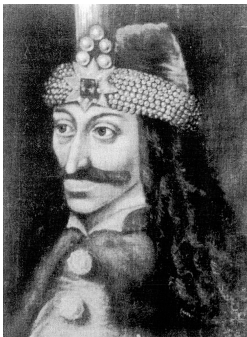
Retrato do voivoda Vlad Tepes, também chamado Drácula (diabo em romeno); nome retomado por Bram Stoker para o seu herói.

Esta particularidade póstuma deve-se inteiramente à imaginação do romancista. Se é verdade que Vlad Tepes, dito