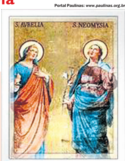
Portal Paulinas: www.paulinas.org.br

SÉCULO XIV. Aurélia nasceu na Ásia Menor, no Oriente, e era muito unida à sua irmã Neomísia. Elas costumavam procurar pobres e doentes pelas ruas para fazer-lhes caridade