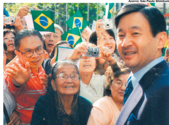
IDOLATRIA. Casal Teramae e o príncipe Naruhito: aconteceu há 11 anos