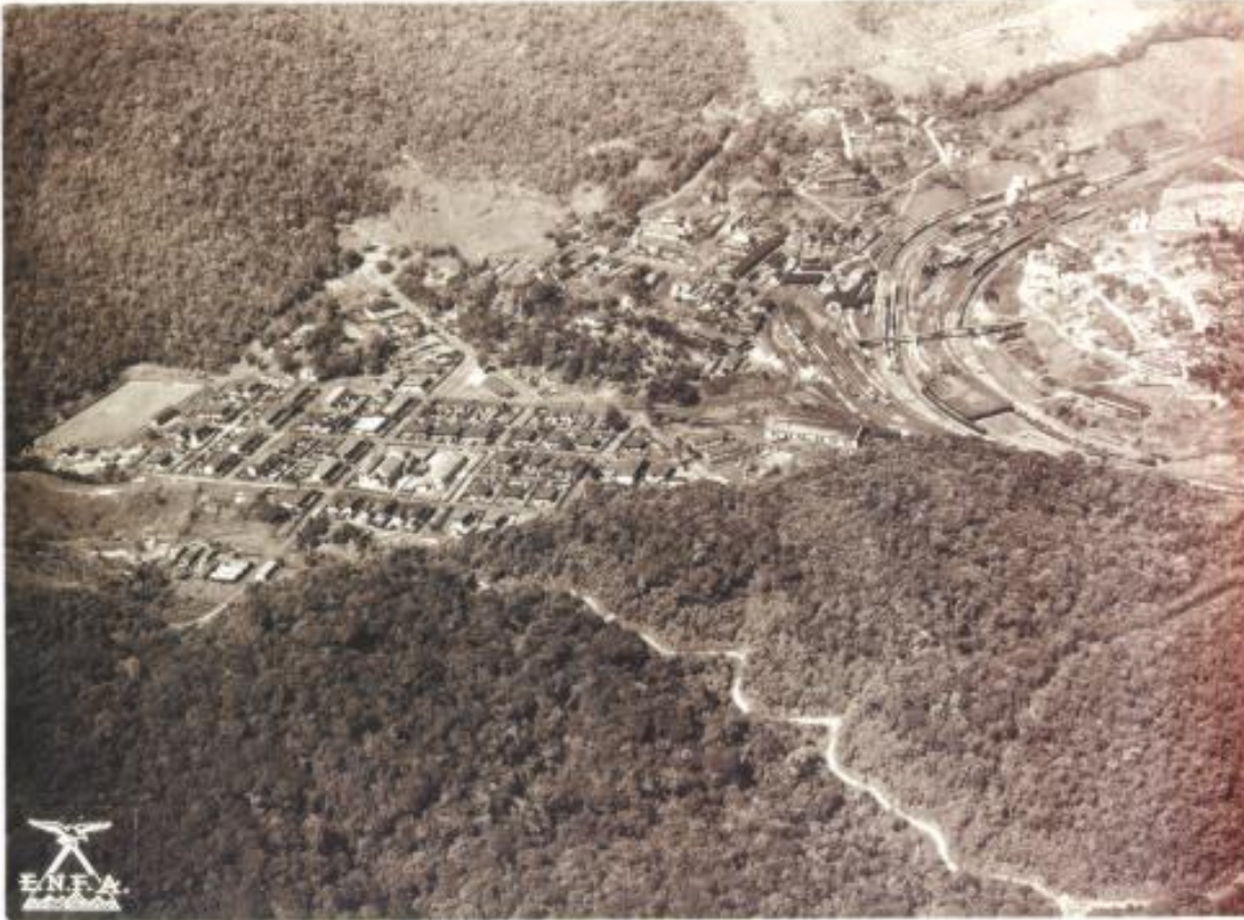
Imagem 1. Foto Aérea de Paranapiacaba em 1940.

Paranapiacaba, que na linguagem indígena significa “local de onde se vê o mar”, conserva um significativo acervo tecnológico ligado a ferrovia e testemunhos de um modelo arquitetônico e urbanístico bastante avançados para a época de sua implantação. Essa vila ferroviária nasceu e se desenvolveu a partir de 1860 com a implantação da Estrada de Ferro Santos-Jundiaí, a primeira ferrovia paulista, construída pela companhia inglesa SPR - São Paulo Railway, para escoar a produção cafeeira do Estado de São Paulo ao mercado internacional. Em 1946, a ferrovia e todo seu patrimônio foram incorporados ao Governo Federal e em 1957 a Rede Ferroviária Federal S.A. passou a administrá-los. A partir dos anos 80 a Vila de Paranapiacaba passou por um intenso período de abandono e degradação.