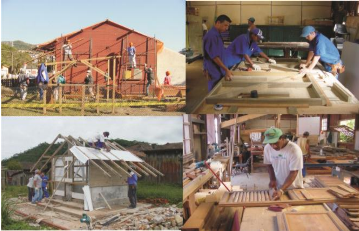
Imagens 7,8,9,10. Cooperativa de Marcenaria, Oficina do Banco de Materiais e Restauro das Casas Tipo E-CDARQ.

Buscando reverter o processo de degradação sofrido no período administrado pela Rede Ferroviária Federal S.A., a Subprefeitura retirava os anexos precários e irregulares dos imóveis. Num primeiro momento procedia-se a retirada quando os imóveis eram devolvidos ou por meio de acordo com os moradores. Até 2008 foram retirados anexos irregulares de 49 casas. A lei da ZEIPP estabeleceu que uma ação mais ostensiva fosse iniciada em 2010, após o término do prazo concedido para a remoção espontânea de anexos irregulares, dentre eles as coberturas para automóveis. Entretanto, a nova administração municipal conseguiu o adiamento deste prazo no legislativo para 2012.