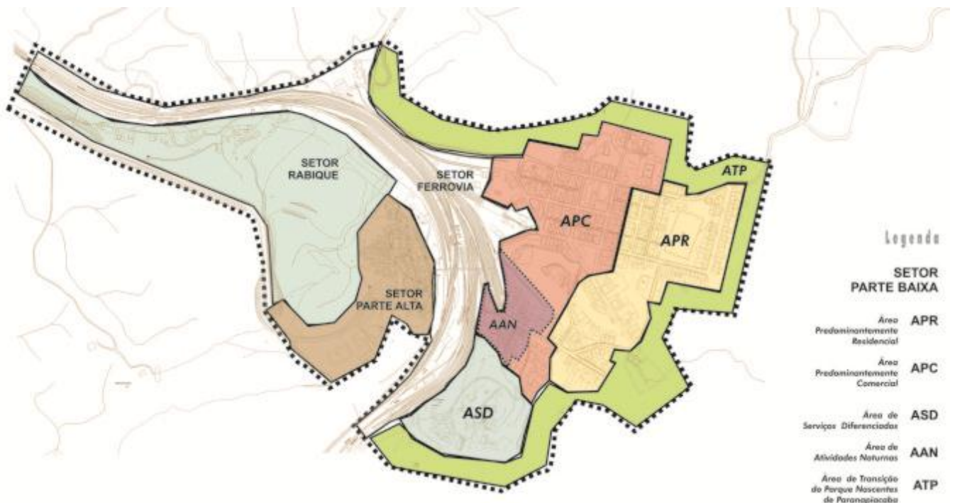
Imagem 6. Paranapiacaba: Zoneamento. Mapa: Vanessa Figueiredo.

Foram redefinidos também os parâmetros de ocupação dos lotes e seus limites, as taxas de permeabilidade, os níveis de incomodidade por emissão sonora e as diretrizes para a preservação das edificações e sistema viário, com o objetivo de salvaguardar o conjunto edificado e as relações urbanas que caracterizam a paisagem da Vila.