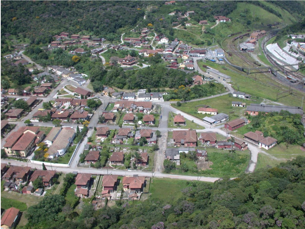
Imagem 2. A Vila Nova (em primeiro plano); o pátio ferroviário (ao lado); a Vila Velha (ao fundo), 2006.