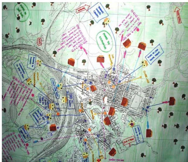
Imagem 5. Biomapa de Paranapiacaba.

Um instrumento bastante utilizado para garantir a gestão ambiental participativa foi o Biomapa, que consiste na realização de inventários biofísicos, ambientais, culturais, sociais e econômicos, constituídos a partir da leitura que as comunidades têm do local onde vivem.