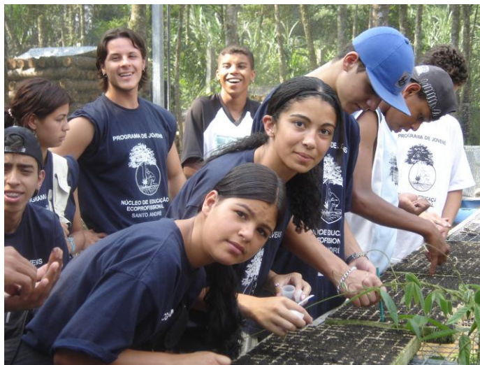
Imagem 10. Programa de Jovens - RBCV – UNESCO