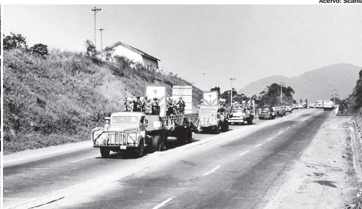
LÁ VAI O OURO... Caminhões Scania são carregados e depois puxam o cortejo pela Via Anchieta: levam o ouro e o dinheiro arrecadados, em direção ao Porto de Santos