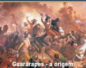
Guararapes - a origem