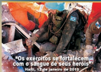
"Os exércitos se fortalecem com o sangue de seus heróis" Haiti, 12 de janeiro de 2010