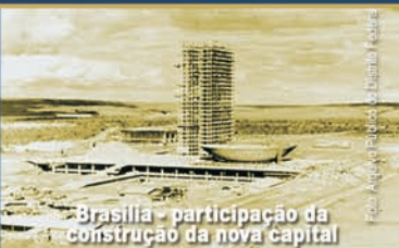
Brasília - participação da construção da nova capital