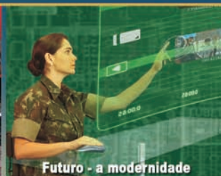
Futuro - a modernidade