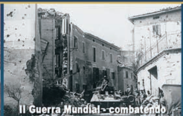
II Guerra Mundial - combatendo