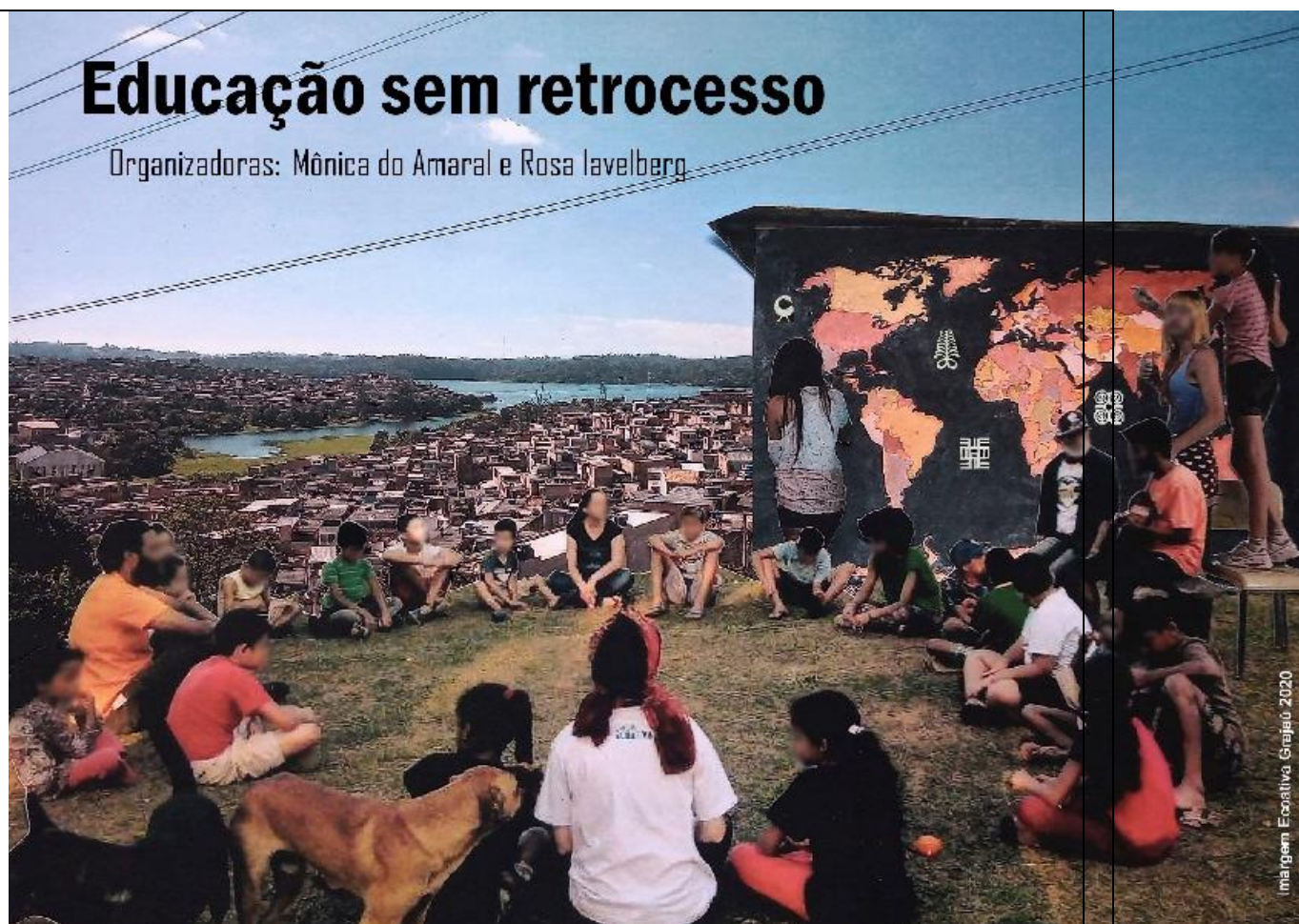
Imagem Ecoativa - 2020 Grajaú SP.

Organizadoras: Mônica do Amaral e Rosa Iavelberg