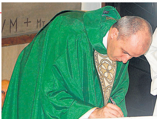
Acervo: Diocese de Santo André

Tema: Encontrar Jesus, Amá-lo e Levá-lo aos Outros. Local: Paróquia Santo André, na Vila Assunção.