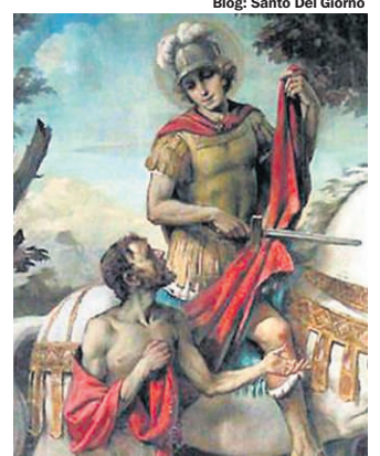
Blog: Santo Del Giorno

■ Martinho de Tours (Panônia, hoje Hungria, 316 – Candes, França, 397). Missionário e bispo de Tours. Tornou-se o primeiro santo não mártir a receber culto oficial da Igreja e também um dos santos mais populares da Europa medieval.