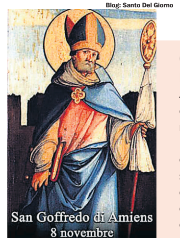
Blog: Santo Del Giorno