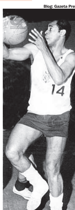
ÍDOLO. Carmo de Souza, o Rosa Branca (1940-2008), bicampeão mundial pelo Brasil: participou dos JAI de 1959 em Santo André