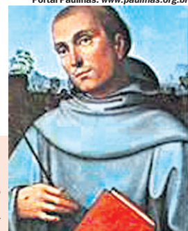
Portal Paulinas: www.paulinas.org.br

FRANCISCO BORJA. Ou Bórgia (1510-1572). Exemplo da nobreza espanhola