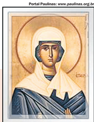
Portal Paulinas: www.paulinas.org.br

PELÁGIA PENITENTE. Viveu no século IV. São duas as santas com este nome – ou quatro, segundo o Martirológio romano. Mas se trata de um desdobramento