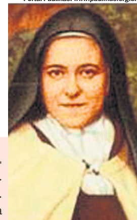
Portal Paulinas: www.paulinas.org.br