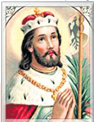
VENCESLAU. Mártir, padroeiro da Boêmia (907-935)