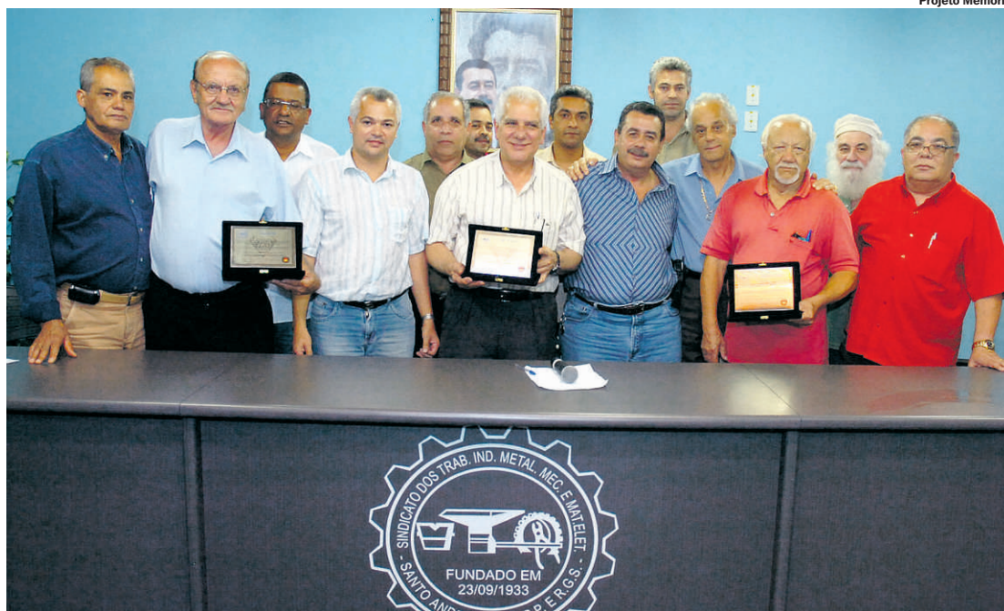
ANO A ANO. Em 2008, festa dos 75 anos dos Metalúrgicos: para lembrar o 23 de setembro de 1933