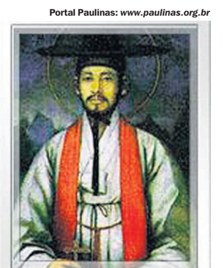
ANDRÉ KIM TAEAGON. Coreano. Em 1846 tornou-se mártir com outros 102 coreanos