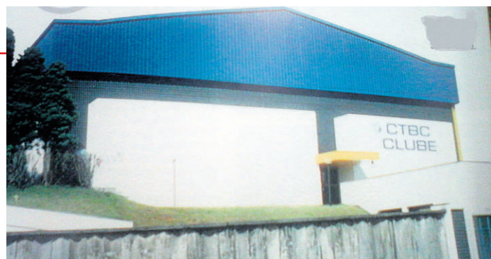
SOB ESSA CAMISA. Momentos do CTBC Clube: a sede que fechará as portas no fim do mês, o futebol de salão entre os anos 1980 e 1990, o vôlei de uma das cinco olimpíadas internas realizadas

A CTBC partiu. Despede-se agora o clube. O jornalista Ivan Lima reuniu imagens mais ou menos datadas. Elas necessitam, porém, de um trabalho a mais, a identificação desta gente que um dia fez esporte no