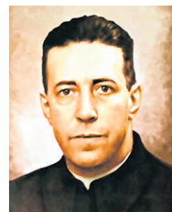
ALBERTO HURTADO. Jesuíta chileno (1901-1952). Fundador do Lar de Cristo

O culto a Santa Helena é um dos mais antigos da Igreja Católica.