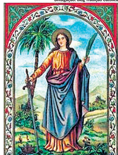
SUSANA DE ROMA. Virgem mártir cristã do século III, festejada no dia 11 de agosto juntamente com São Tibúrcio