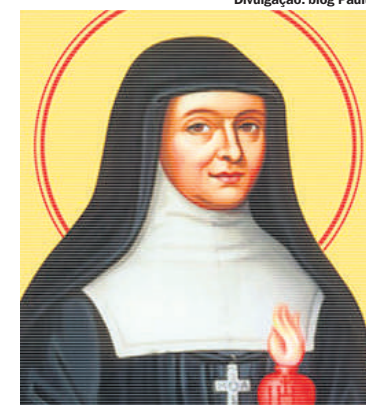
JOANA FRANCISCA DE CHANTAL. Religiosa francesa (Dijon, 1572 – Paris, 641)