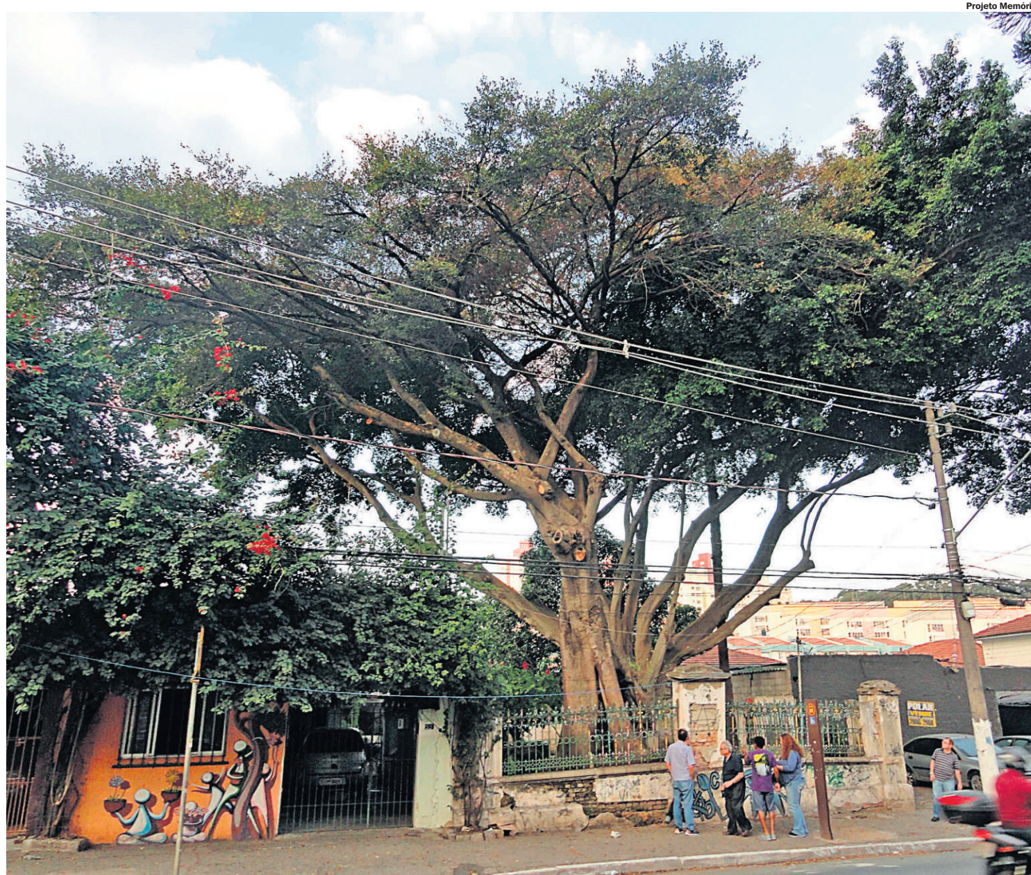
15-6-19. Sou a árvore das lágrimas e das saudades. Sob a minha sombra corações sem número separaram-se afitos: do poema de Eugênio Egas, 1920

1919 – Seleção Paulista de Futebol vence a do Rio, no campo do Fluminense, por 4 a 2, e conquista a Taça Rodrigues Alves. Neco, do Corinthians, marcou três gols. INTERNACIONAL ■ Do noticiário do Estadão : Basileia, 6 (UP) – O tratado de paz será submetido à Assembleia Nacional alemã para a sua ratificação na próxima semana. ■ Do noticiário do Correio Paulistano : Londres, 6 – Informam de Roma que foi proclamada a lei marcial em Forlì e Imola, devido a conflitos de caráter maximalistas ali havidos. Em Florença houve duas mortes por ocasião de um ataque a casas comerciais. 1944 – Começa a festa de Nossa Senhora do Carmo, em Santo André. 1959 – Iniciadas as solenidades de 9 de julho, com a chegada dos despojos de dez heróis da Revolução Constitucionalista à Praça da República, em São Paulo, no lugar onde Martins, Miragaia, Drausio e Camargo tombaram em 1932.