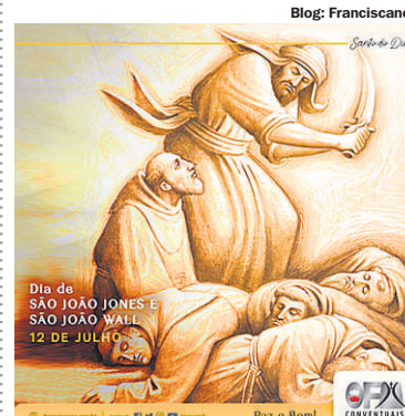
JOÃO JONES E JOÃO WALL. Franciscanos ingleses. Jones martirizado em 1598; Wall, martirizado em 1679

■ João Gualberto (Itália, Florença, 995 – Umbria, 1073). Monge. Fundador de mosteiro segundo as regras de São Bento. Padroeiro da Guarda e Engenharia Florestal.