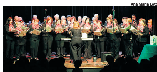
BICCHIERE D'ORO. São Bernardo, 1983: a tradição musical viva trazida pelos imigrantes do Norte da Itália

Participação: Bicchiere d'Oro, Coral Infanto-Juvenil de São Bernardo, Coral Vita Bella (Salto), Grupo Stella Bianca (Jarínú) e Coral da Associação Trevisani nel Mondo Cascalho (Cordeirópolis).