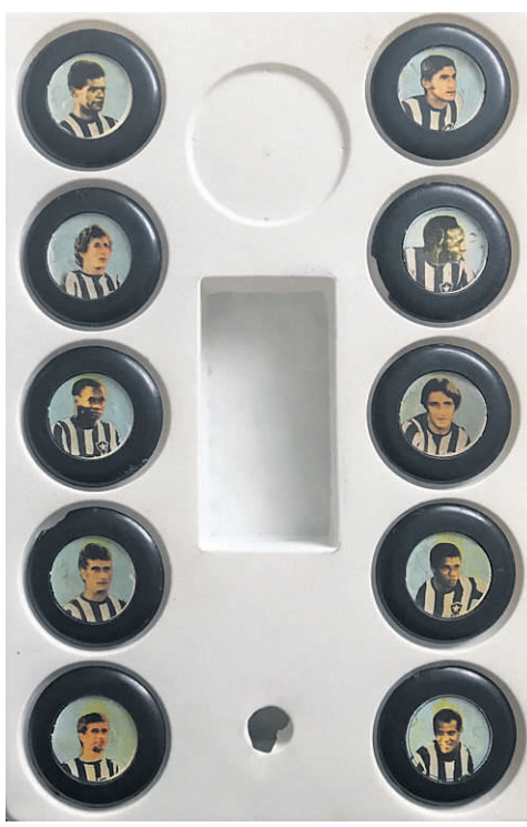
Jogo de botões, com o espaço para o goleiro faltante