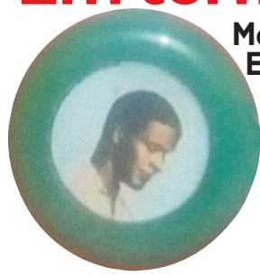
O botão do jogador desconhecido.