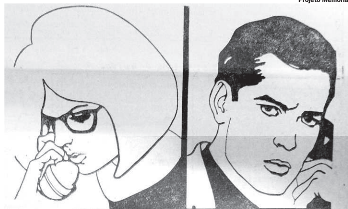
PRÊMIO AQUISIÇÃO. Desenho de Claudio Tozzi que retrata heróis de quadrinhos