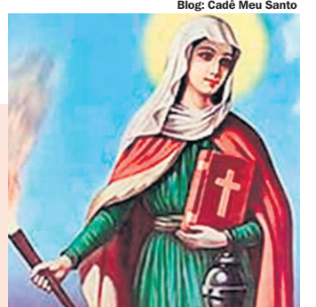
Blog: Cadê Meu Santo

SANTA MARTA. Em aramaico significa “senhora”. Era a irmã de Maria e de Lázaro. Por várias vezes Jesus hospedou-se em sua casa. É considerada a patrona das cozinheiras e das donas de casa