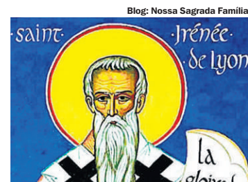
Blog: Nossa Sagrada Família

IRINEU . Discípulo de São Policarpo, que por sua vez foi do apóstolo São João. Nasceu e se formou na Ásia Menor. Viveu na Gália e foi bispo de Lyon, na França. Ali faleceu no ano 202