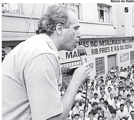
Banco de Dados