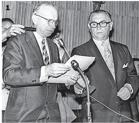
Banco de Dados