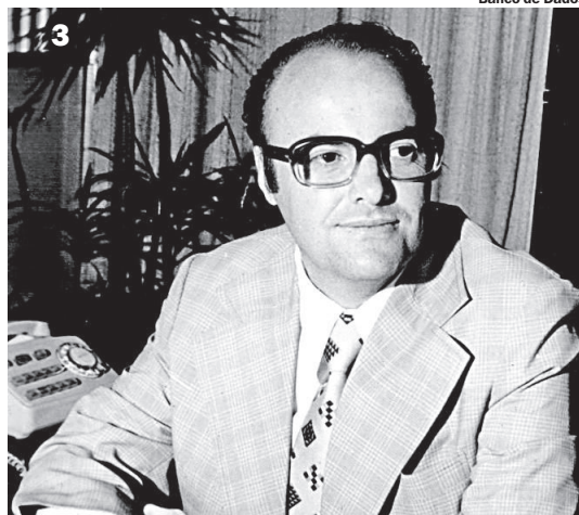
Banco de Dados