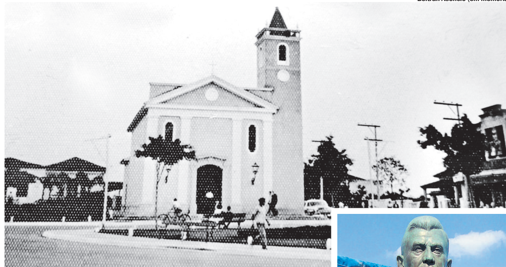
Beltran Asêncio (em memória)

O pouso de tropeiros do bairro dos Meninos ficava na bifurcação da Estrada do Vergueiro com a Estrada das Lágrimas. Mas qual bifurcação?