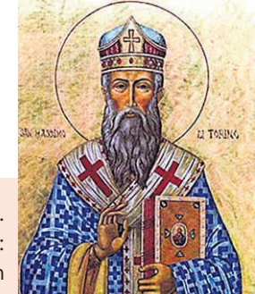
Blog: Arquidiocese de São Paulo