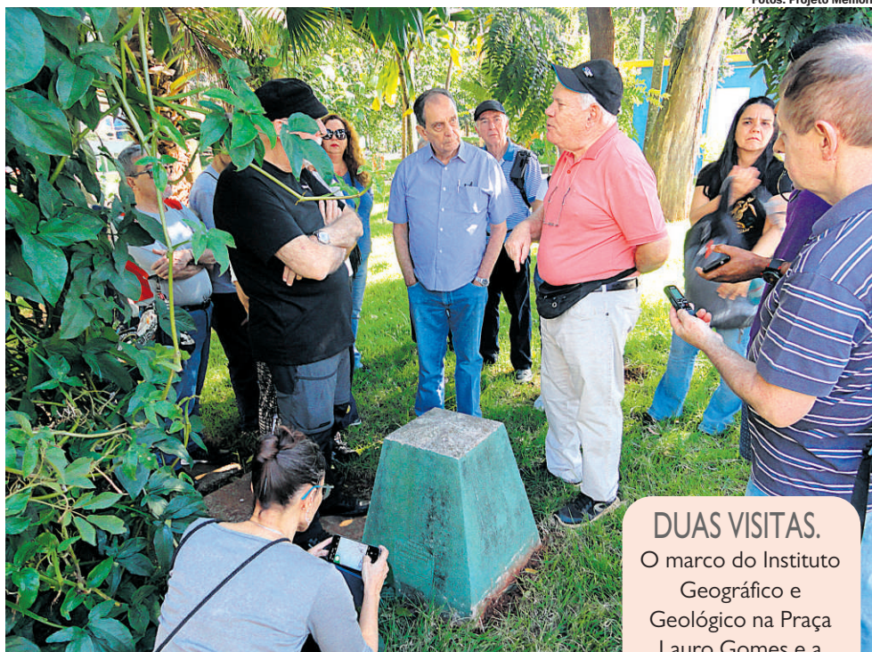
DUAS VISITAS. O marco do Instituto Geográfico e Geológico na Praça Lauro Gomes e a entrada na Basílica da Boa Viagem: marcas do primeiro loteamento do Grande ABC

Esse marco instalado na Praça Lauro Gomes faz parte da rede de nivelamento do IGG (Instituto Geográfico e Geológico) do Estado de São Paulo. Nas obras de engenharia é necessário conhecer a altitude em relação ao nível médio do mar. A equipe de nivelamento partiu do marégrafo da Mortona, no Porto de Santos, no fim da década de 1920. O primeiro marco foi instalado em Santos, no prédio da alfândega. Diversos outros intermediários foram implantados ao longo da estrada de rodagem, como este que se vê na foto. O marco final dessa primeira implantação encontra-se nos fundos do edifício do Museu do Ipiranga, representado no Mapeamento da Sara Brasil.