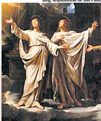
Blog: Arquidiocese de São Paulo

Objetivo: conciliar vida de solidão absoluta e vida comunitária.