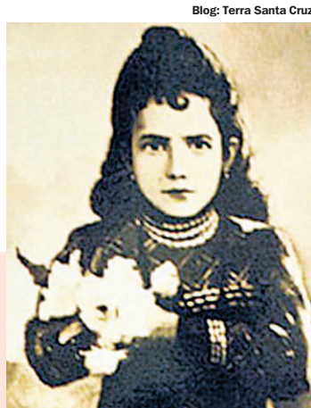
Blog: Terra Santa Cruz