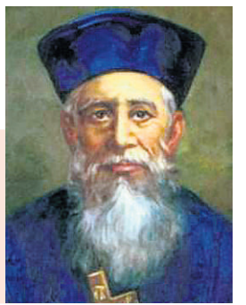
FRANCISCO RÉGIS. (França, 1597-1640). Fundador das Confrarias ou Irmandades do Santíssimo Sacramento.