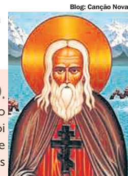
Blog: Canção Nova