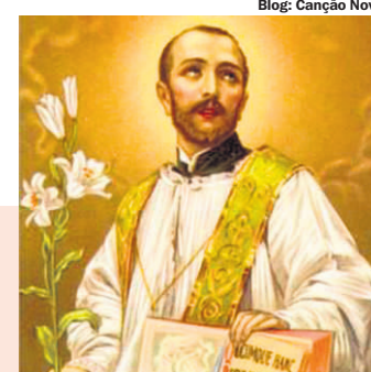
Blog: Canção Nova

ANTONINO (Itália 1389-1459). O bispo e arcebispo que atendia a todos os mendigos