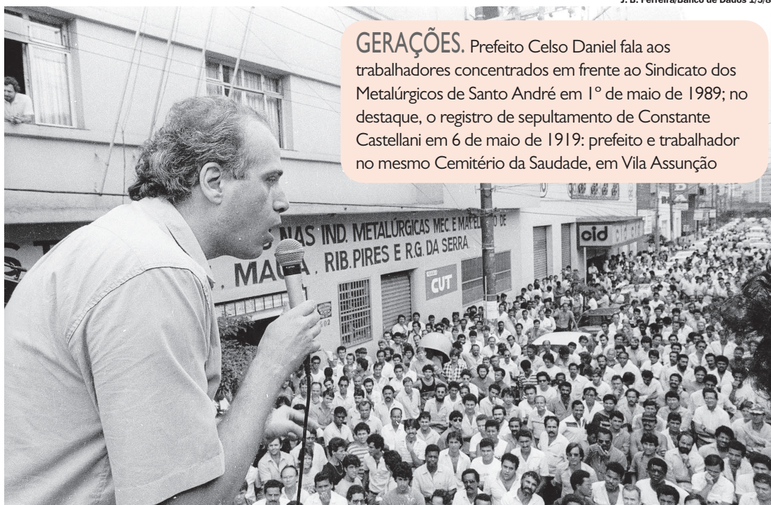
J. B. Ferreira/Banco de Dados 1/5/89

Memória pretende acompanhar os concursos, divulgar os vencedores, cobrir a festa final e demonstrar às demais instituições este belo exemplo que parte dos Químicos.