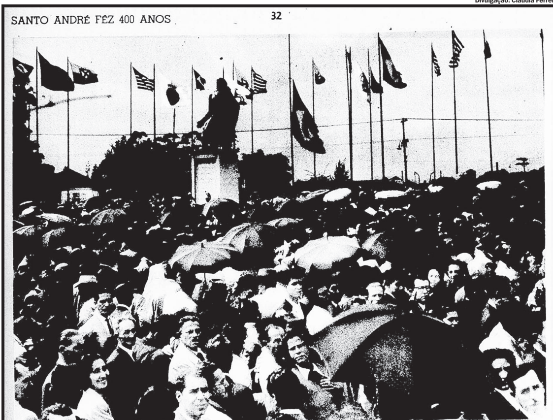
O povo, sem distinção de classes, credos ou partidos, solidário com as autoridades nas brilhantes comemorações, encheu as praças e ruas