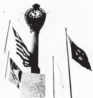
O belo e monumental relógio oferecido pelos japoneses locais para marcar os dias e as horas futuras do progresso de Santo André