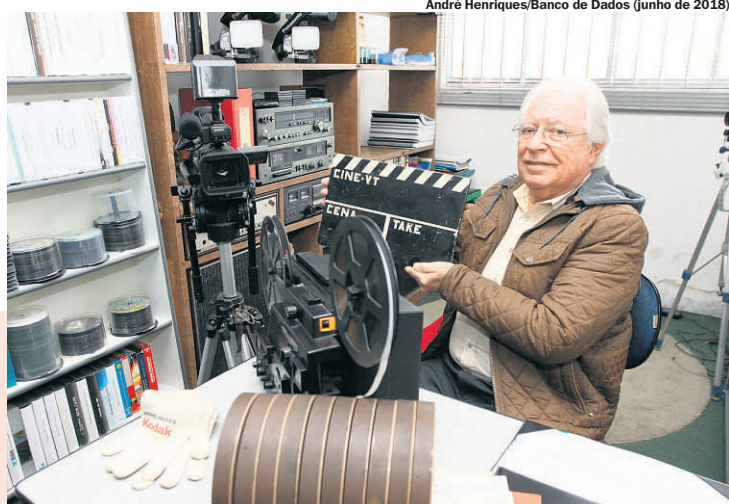
André Henriques/Banco de Dados (junho de 2018)