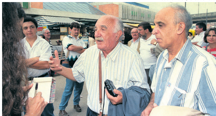
Luciano Vicioni/Banco de Dados