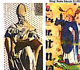
BRAULIO E LUDGERO. Santos festejados em 26 de março