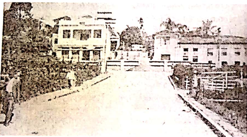
PASSAGEM DE NÍVEL. A Rua do Comércio aponta para a Avenida Santo André, com a antiga sede do Ribeirão Pires FC à esquerda