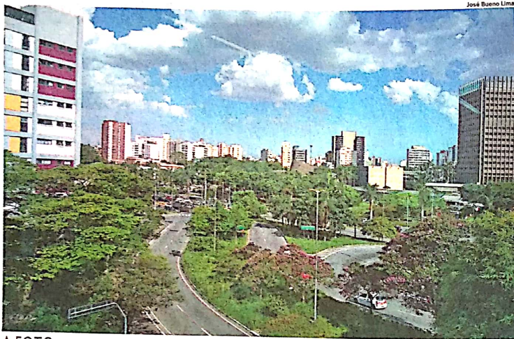
A FOTO. Segunda-feira, 21 de janeiro de 2019. Toda formosura de jardins ao longo da Perimetral e no entorno do centro cívico de Santo André: conjugação ambiental e arquitetônica nascida na segunda metade dos anos 1960