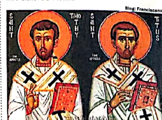
TIMÓTEO E TITO. Colaboradores do apóstolo Paulo