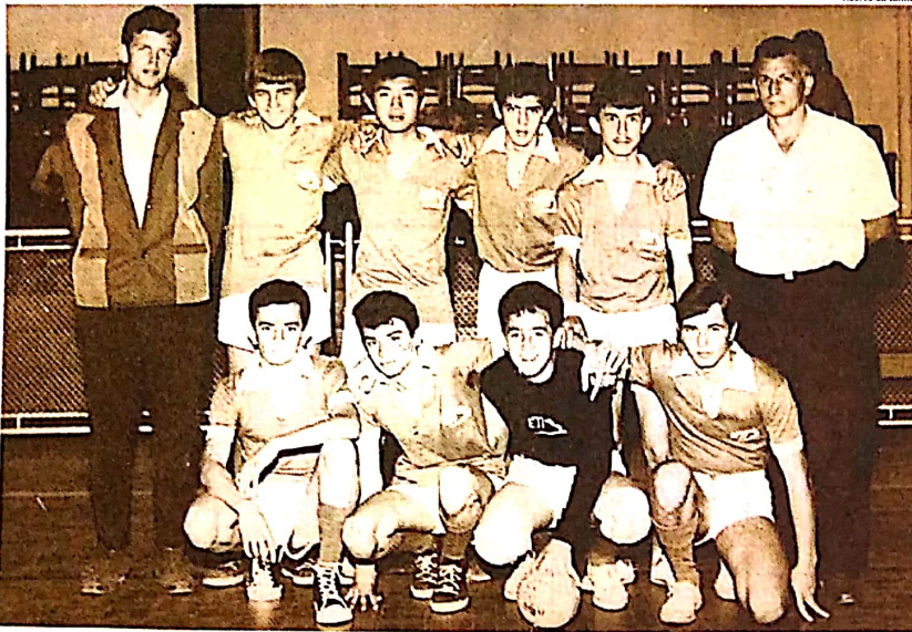
Aceno da turma