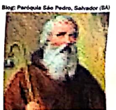
ANTÃO. A morte aos 105 anos

■ Sulpício, bispo francês falecido em 644