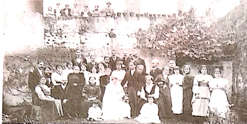
O CASAMENTO. Residência da família Raposo Tavares em Ponta Delgada em 1917. Doze anos depois parte da família muda para o Brasil, deixando uma história que aos poucos vai sendo reconstruída