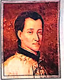
Blog: Sagrada Missão (Grupo de Oração Católico)

CLAUDIO COLOMBIERE. Proclamado santo em 1992 pelo papa João Paulo II